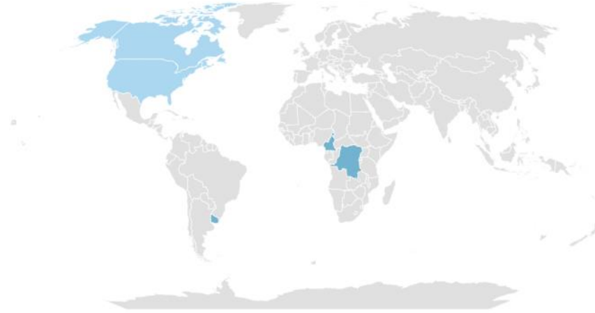
Tableau représentatif de la distribution de l'emplacement de l'ensemble de nos fournisseurs lorsque Alphonse Lepage inc. est l'importateur officiel.

Alphonse Lepage inc. se procure la majorité de ses marchandises et matières premières auprès de fournisseurs nord-américains totalisant 90% de son approvisionnement et moins de 10% en proviennent de régions de l'Amérique du Sud et de l'Afrique, lorsqu'il est l'importateur officiel.