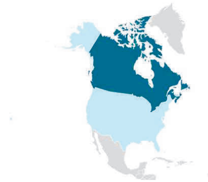
Tableau représentatif de la distribution de l'emplacement de l'ensemble de nos fournisseurs lorsque Sartigan Inc. est l'importateur officiel.