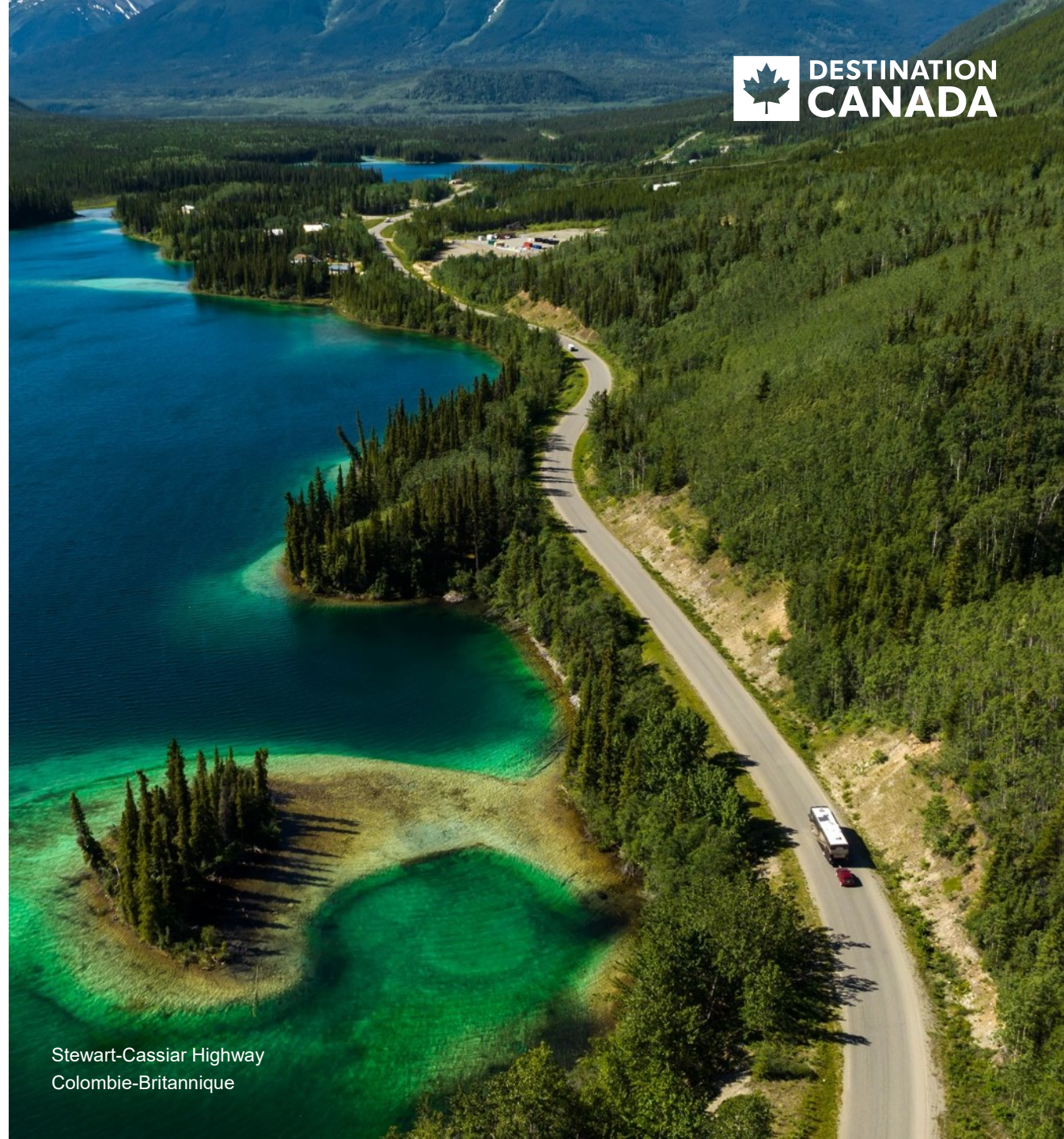
Stewart-Cassiar Highway Colombie-Britannique